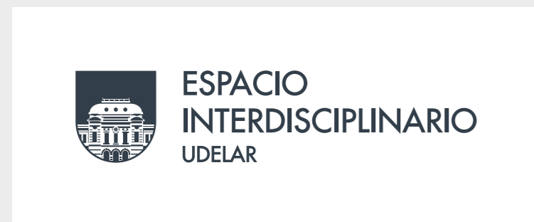
Aplicación logo gris.