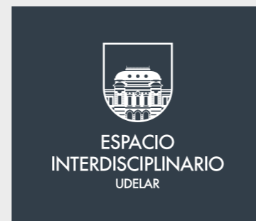
Aplicación vertical sobre fondos oscuros.

Atención: la aplicación positiva y negativa son diferentes.