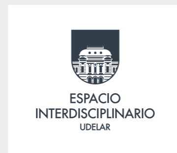
Aplicación vertical gris.