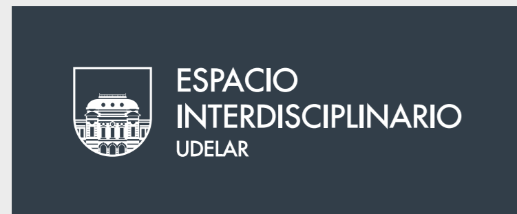
Aplicación sobre fondos oscuros.