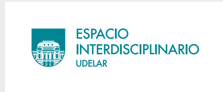
Aplicación logo verde.